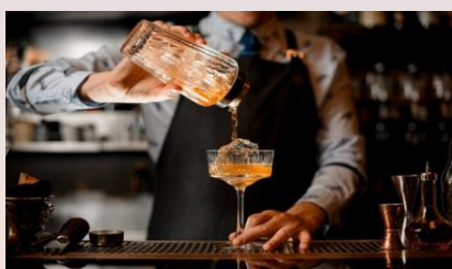
两杯免费迎宾饮品

参观香港贸易发展局在五月假香港会议展览中心举行的香港国际医疗及保健展2023，从一系列专属体验中选择一项礼遇：