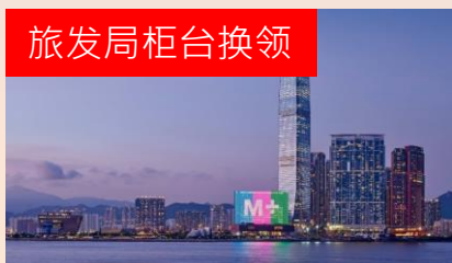
免费M+博物馆一天入场门票